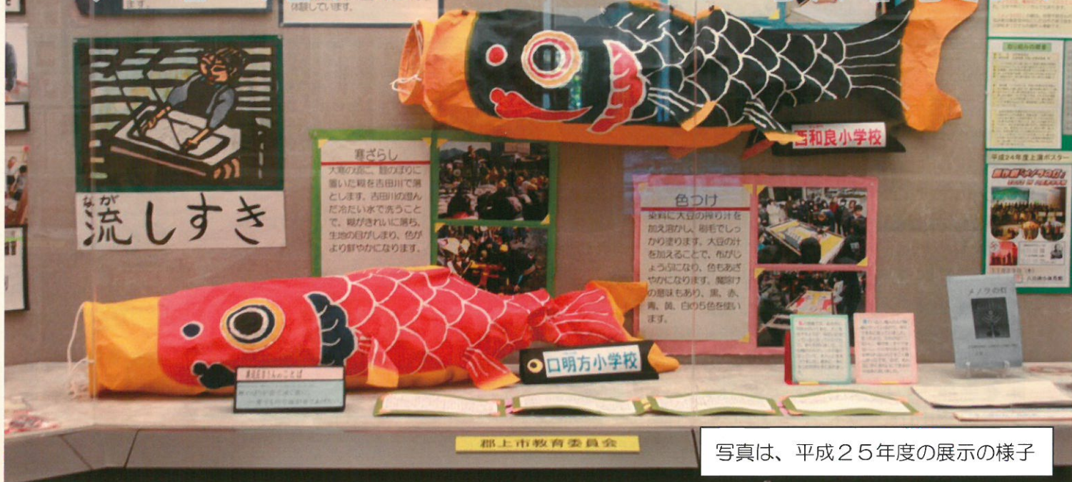
写真は、平成25年度の展示の様子

岐阜県では、「清流の国ぎふ」への誇りと愛着を育む地域に根ざしたふるさと教育を推進しています。 平成26年度ふるさとと教育展では、県内23校の取り組みを紹介します。