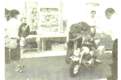
警察ふれあい広場の模様

来場者に、振り込め詐欺や悪質商法被害防止、交通事故防止のチラシ等を配付して、被害防止や事故防止を呼びかけました。