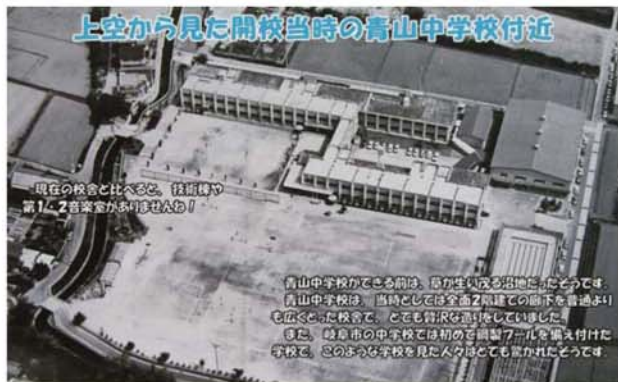
上空から見た開校当時の青山中学校付近

「中学生からのハローワーク」は、今年度で11回目となります。生徒に「自分の生き方を考え、主体的に進路を選択できる力」が育つことを願い、講師を務めてくださる地域住民等の協力により、開催されました。今年度は生徒から意見を聞き内容を直し、希望に沿った講師をお願いするなどして合計39名の方々から、仕事上の今後の夢や希望、仕事選びのポイントなどをお話し頂きました。