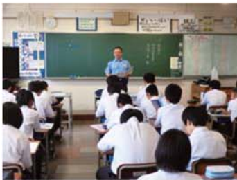
↑生徒は1講座45分間の講話を3講座聞くことができ、講師の仕事内容や、辛かったこと、嬉しかったこと、その職業に就くための資格などについて真剣に聞いていました。

毎月第3火曜日は鷺山校区では「資源分別回収の日」です。ちょっとした紙も雑がみで資源回収をしよう！