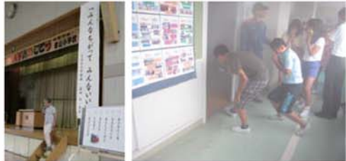
↑土曜日の授業では、消防署の皆さんの指導で命を守る訓練を行ったり、講師を招いてのハートフル人権ライブなどを行いました。これからは地域の皆さんと一緒に取り組む活動を中心に実施していきます。