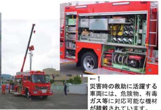
←災害時の救助に活躍する車両には、危険物、有毒ガス等に対応可能な機材が積載されています。