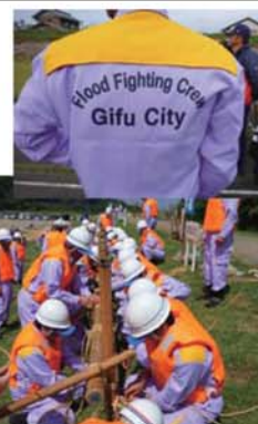
↑新しい活動服は機能性が向上しています。その新しい活動服を身にまとい、連合演習に参加しました。

破堤することがないように対策を講じるものです。昨年と異なる工法の実施でしたが、日頃の訓練の成果が発揮され、すばらしい活動となりました。