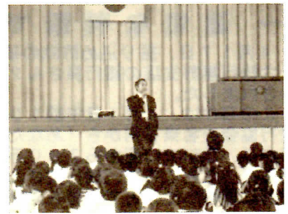
不審者対策防犯講話の模様