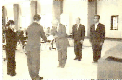
新規委嘱状交付の模様