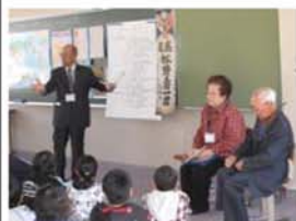
6年生は、戦争体験者からの戦時中のお話

地域の方を講師にお招きして、それぞれの学年が体験活動を行なっています。 活動が終わったあと、講師の方がお帰りの際「子どもたちから元気をもらいました。一緒にやってみよう。良かった。」と温かい言葉をいただきました。子どもたちも充実感を持って活動