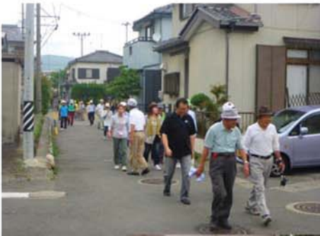
← 鷺山小学校グラウンドを出発して、メモリアルセンターを目指し、歩け歩け大会です!!

平成25年6月1日(土)に鷺山体育振興会主催で鷺山歩け歩け大会が開催されました。ここ数年実施されていきましたが、昨年度作成された「みんなが歩く! 健康さんぽ道マップ」を活用して、開催することとなりました。歩いたコースは、鷺山小学校く北野神社く森田草平記念館前く道三塚くメモリアルセンターく清洲交差点く鷺山本通り