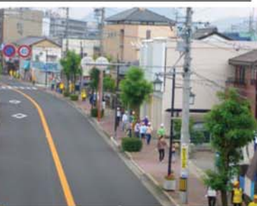
↑ 帰りは本通りを歩いて、鷺山小学校グラウンドを目指して歩きました。