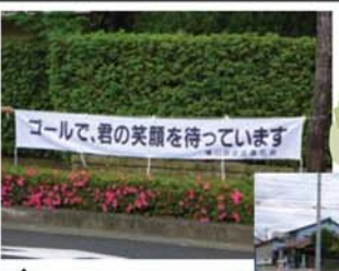
↑ 自治会連合、体育振興会も、ボランティアや横断幕の設置等で、盛り上げていきました。