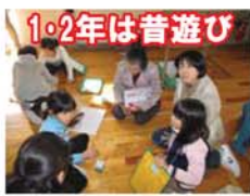
1・2年は昔遊び 3年は竹箸作り

できました。この活動で、「生活の知恵」や「地域の良さ」に気づかせていただくことができました。ふるさと鷺山を大切に、地域の人と共に生きる気持ちを持っていきます。