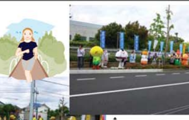
↑ う~たんをはじめ、ゆるキャラ達も大集合! みんなで選手の手を応援していました。

手応援などを通して、盛り上げていきました。この大会が、市民の皆さんの手によってすばらしい大会に育つていくことを願うばかりです。