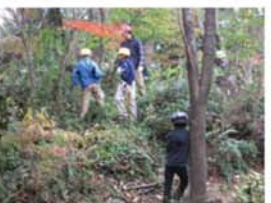
4年生は、のこぎりを使った鷺山の整備活動