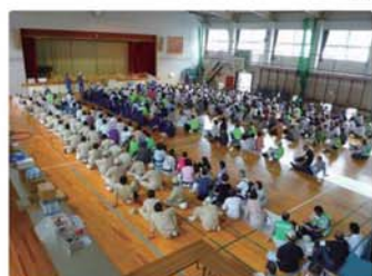
鷺山校区自主防災隊 避難所開設防災訓練を実施