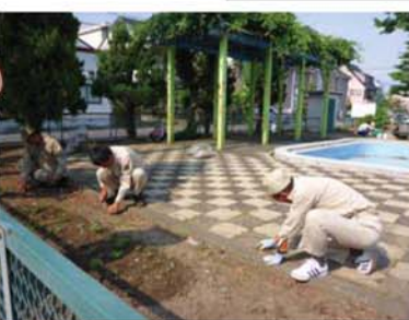
↑ 鷺山水防団の団員の皆さんもごみゼロ運動に参加下さいました。

住民の皆さんが日々集まる憩う場所や歩いて眺める景色が美しくなったのではないのでしょうか。そして何よりも、このように「ごみゼロ」の活動に参加して下さった住民の皆さんの気持ちの美しさを輝かした瞬間ではないかと感じました。