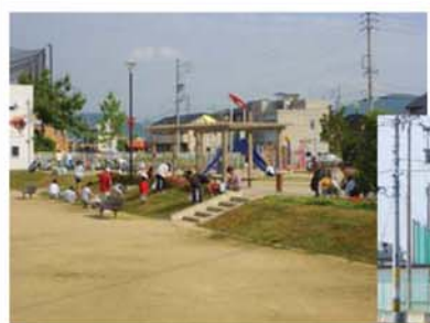
↑ 各地区の公園、周辺の植栽など各地区で清掃に取り組みました。

特に、鷺山校区南部に位置する正木川では、周辺の自治会が一斉に清掃に取り組みました。日頃、水が流れなくなっているから、川の中にも達まで参加し、川の中に生えた雑草の除去、空き缶等ゴミの回収にも取り組みました。区画整理が行われ各地区に設置された新しい公園でも、芝やツツジ等植栽の手入れをはじめ、雑草取りなどが行われました。