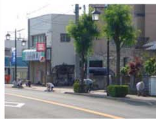
↑ 鷺山本通り各所でも、たくさんの住民の皆さんが、清掃を行って下さいました。バス停周辺、植栽の手入れなど色々な箇所の手入れを行いました。