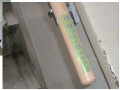
掲載は七月十日分までとなっています。