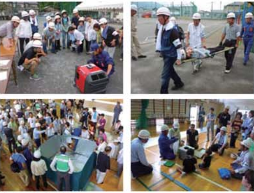
↑ 避難所開設に必要な発電機、簡易トイレ、パターション等備品の使用方法を実践していきました。また、傷病者の運搬、手当についても指導を受けました。

東海地方でも南海トラフによる大規模災害が想定される中、いつそのような災害に直面するかわからない状況です。そこで、今年度の鷺山校区自主防災隊 防災訓練では、昨年12月に実施した避難所開設訓練の規模を更に大きくし、より多くの皆さんにどのような備品が備え付けられているのか、どのよう備品を使用するのか知ってもらうと共通に、多人数で避難所開設を行った際にどのようなトラブルが発生するのかわからないための訓練と位置づけ、各地区に分かれて避難所開設訓練を行いました。