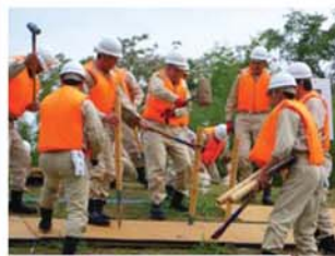
↑ 鷺山水防団は、畳と木杭を使った畳張り工を実施しました。力を合わせた手際よい作業は見事でした。

また、この演習には、三輪中学校、東長良中学校の生徒の皆さんも参加され、土のう積みを実践していただきました。このような経験は生徒の皆さんにとっても非常