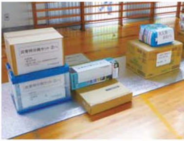
↑ 避難所の備品には、妊婦の急な出産にも対応できるように分娩セットも備え付けられています。

今年の避難所開設訓練は、各自治会から複数名の方に参加頂き、昨年未の規模より大きな規模で実施しました。