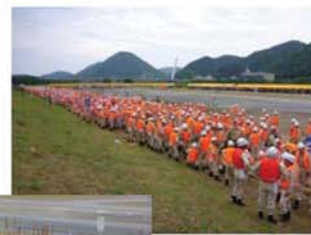
← 総勢1800名での土のう作りに、中学生も参加しました。