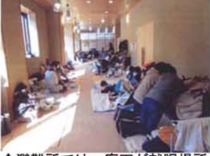
↑避難所では、廊下が就眠場所