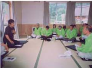
↑広瀬公民館長との意見交換