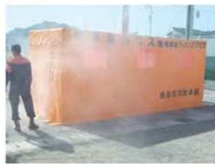
↑鷺山小学校グラウンドにおいて、地震体験車や煙体験ハウスによる災害時の体験活動が実施されました。煙体験ハウスでは無毒の煙の中で、火災時の疑似体験ができました。煙の中での視界の狭さには、本当に驚かされました。

3月11日に東日本大震災が発生してから1年以上が過ぎました。しかし、まだ復興への道半ばであり、被災者及び被災地のことを考える心が続く日が続きます。そんな中、我々も東海地震の襲来が予想されるため、気を引き締めなければなりません。そんな気持ちを持ちながら5月27日(日)に自主防災隊の結成式を執り行いました。