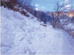
↑雪崩で通行止になった道