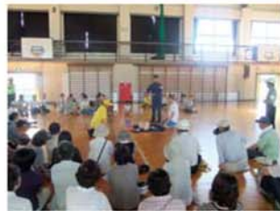
↑青山中学校体育館においては、下土居の自治会を対象に心肺蘇生訓練、AEDの使用法の訓練が行われました。