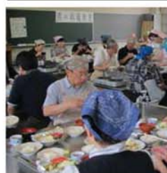
→ 麺棒の使い方に苦労しながら餃子の皮を一枚一枚作っていました。

餃子の良し悪しは「あん」ではなく「皮」で決まるため、皮づくりのポイントを指導いただきました。強力粉、白玉粉、塩、サラダ油に熱湯を加えた生地を皮をつくり、あんを包んでいきました。皮づくりでは初めて麺棒を使う人ばかりで、うまく生地を薄く、丸くすることが出来なかったようです。 他にも「春雨スープ」「枝豆ご飯」「きゅうちゃん漬」「豆乳ゼリー」が加わり豪華なメニューとなりました。 試食会では、餃子の大きさや形が一定でないという声や素人づくりにしては上出来だという声も聞かれました。 今回の料理教室は長良西、岩野田、三輪南校区食改推進員さんの皆さんに大変ご協力をいただきました。 次回は10月23日(火)開催予定です。