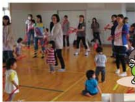
↑ 3B(ボール、ベル、ベルダー)を使った3B体操やリラックスマ体操を参加者みんなで行いました。

主任児童委員、民生委員、青少年育成市民会議、子育て支援サークルなどの協力で、5月9日(水)鷺山子ども館において、60名が参加し「子育て支援ひろば」3B体操を開催しました。3B体操は、指導の高橋先生とスタッフの指導で、ボール・ベル・ベルダーを使い「心と体を動かす工夫」をした3B体操、若いお母さんたちはリラククス体操を行い、楽しいひとときを過ごしました。 今回、初めて鷺山子ども館(旧鷺山保育所)で開催しましたが、駐車場台数が少ない等の課題があり、参加者の減少が懸念されましたが、大勢の方に参加いただきました。