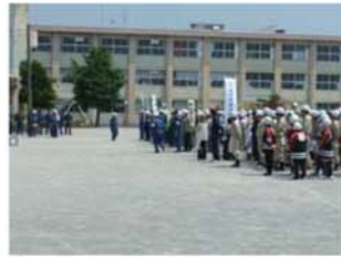
↑各自治会関係者、消防団、水防団、女性防火クラブ、日赤奉仕団等関係団体による自主防災隊結成式が鷺山小学校グラウンドで執り行われました。