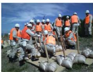
↑畳張り工法により、堤防を強化する訓練が実施されました。団員一人一人が手分けして、手際よく工法を完成させていきました。

鷺山水防団は、佐波水防団、木田水防団と協力して、土のう作成、土のう積みを実施していきました。