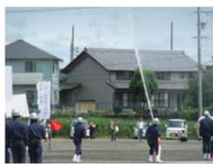
↑今年の特別点検から、実際に放水を行う形式での操法が実施されることになりました。鷺山分団もスムーズに実施することが出来ました。

6月17日(日)には、岐阜北消防団に所属する15分団が合同で特別点検を実施しました。今年から特別点検での消防操法で実際に放水することになり、4月から週2回、鷺山分団一丸となり訓練を続けてきました。特別点検当日は、前日の雨のため、グラウンドコンディションが悪く、無事に消防操法を実施することが出来ませんでした。