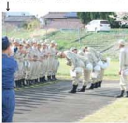
↑先輩の消防団員が見守る中、岐阜北消防団長から新人団員に辞令が交付されました。

平成24年度の最初の訓練日に、新人団員5名に辞令が交付されました。辞令交付後、早速土のう作成等訓練が行われました。