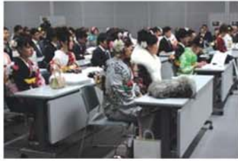
↑多くの新成人が、各種団体長をはじめとした来賓の皆さんに見守られる中、素敵な衣装に身を包み新成人を祝い励ます会に参加されました。

1月8日に、長良川国際会議場において、鷺山新成人を祝い励ます会が開催されました。今年度の鷺山の新成人対象者は、平成30年4月1日～平成31年4月1日までの85人です。式典には、各種団体長をはじめ、小学校6年生の時の担任の先生方にもお越し頂き、厳