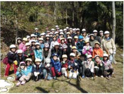
↑参加者全員で記念撮影を行いました。たくさん子ども達が、一生懸命活動してくれました。

この日は、約60人の親子が、鷺山の頂上付近や南側斜面を中心に、枯れ木、枯れ枝、常緑広葉樹の処理をしていただきました。参加者の皆さんは、活動で森が明るくなつていく様子を実感されながら、一生懸命取り組んでいました。活動終了後には、PTA役員の皆さんが準備してくださった豚汁とおにぎりを頂きました。今年も鷺山の桜が美しく咲いてくれるといいですね!!