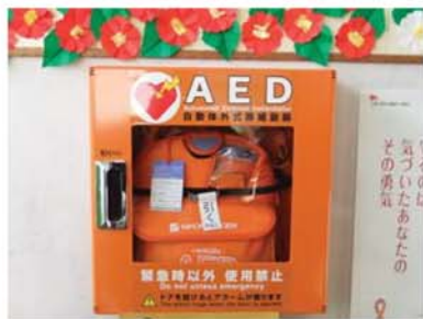
↑ 鷺山子ども館の玄関西側の壁に据え付けられています。

対応について講習が行われました。今回設置されたAEDは大人・子供兼用ですが、小学校に通っている1年生以上は「大人」、未就学児は「子供」として機械を扱うこととなります。使い分けは簡単です。機械の表面に切替スイッチがついています。このスイッチを切り替えて使い分けを行います。なお、基本的な使用方法は、AEDの音声メッセージに従うことが出来るので、ご指示に従って使用してください。なお、鷺山子ども館は、直接取りに来ていただく必要はありません。夜間、年末年始等、子ども館閉館時にはAEDを使用しないこととなります。発生したときは、鍵を預かってもらっていただきます。