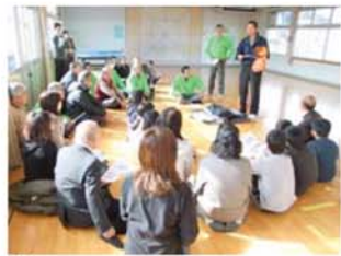
↑ AEDの納入担当者から、今回鷺山子ども館に納入された最新式のAEDの取り扱い及び救急方法についてレクチャーを受けました。

この度、鷺山保育所と鷺山子ども館(旧鷺山保育所跡)に最新式のAEDが設置されました。「AED」とは、自動体外式除細動器のことで「心室細動」という心筋の無秩序な動きを改善するための応急処置をする機械です。今回設置された機械は、最新式のもので設置されており、「大人と子供兼用」であると共に、「0歳以下の乳児」にも使用できるタイプです。このAEDの設置に伴い2月18日(土)、20日(月)に取り扱い方法及び緊急時の