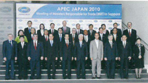
APEC貿易担当大臣会合(6月札幌)

鷺山夏祭り大会では、ペットボトルキャップの回収活動に取り組みます。 ◆回収場所 メイン会場本部付近 ゆるキャラブース ◆お願い 紙等のシール類は、はがしてね 中側にはめ込まれている スポンジがあれば取り除いてね ウインド鷺山東