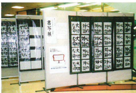
小学生の書写展 (昨年マーサ21で)

一方、次世代を担う青少年の健全育成に力を入れ、例えば、小学生を対象に非行防止にちなんでの「書写コンテスト」を実施して、