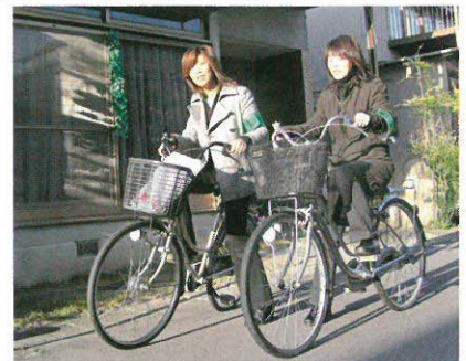
小学校PTA通学パトロール

き上げるために、活動を推進しています。今年度からは、地域の皆さんへのあいさつ運動に取り組んでいます。現在、児童に対して、家庭、学校が協力して鷺山の地域の皆さんに進んであいさつができるように雰囲気作り、呼びかけを行っています。家族や友達へのあいさつは当たり前!鷺山の皆さんへあいさつを進んでしよう!と取