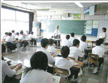
昨年のハローワーク

を生徒に話していただきます。地域の皆さんも参加していただけますのでぜひ学校へお出かけ下さい。