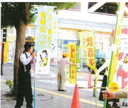
昨年の交通安全フェア(マーサで)

◎歩行者・自転車利用者向け 「自転車も ハンドル握ればドライバー」 ◎子ども部門 「青だけど車は私を見るかな」