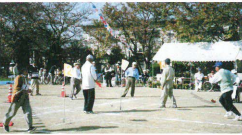
なかよし運動会の様子 (清流園)

主な催しの一部を紹介します。なかよし運動会、日帰り旅行、鶺鴒を観る会、ゲートボール、囲碁・将棋大会…。