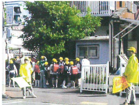
毎月15日 交差点で街頭活動

◎歩行者・自転車利用者向け 「自転車も ハンドル握ればドライバー」 ◎子ども部門 「青だけど車は私を見るかな」