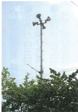
防災行政無線(鷺山小学校)

二ティ計画」を、常に最新の計画であるよう定期的な見直しを図っていただき、地域の総合防災体制の充実・強化に向けて、更にご尽力を賜りますようお願い申し上げます。