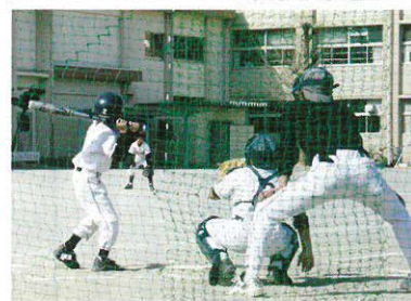
野球部 練習試合 鷺山小学校で

剣道は10人が水・金・土曜の夕方6時から8時30分、バレーは21人が土日の午前中、空手は13人が火・金曜の夕方6時から7時30分、ミニバスケットは土・日曜の午前、午後27人が、そして、野球は24人が土・日曜にグラウンドで活動していま