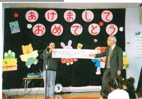
園児と新年楽しみ会 (鷺山保育所)