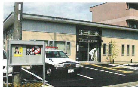
鷺山校区受持ちの則武交番 則武小学校東 058-232-7731(従来通)

二ティ計画」を、常に最新の計画であるよう定期的な見直しを図っていただき、地域の総合防災体制の充実・強化に向けて、更にご尽力を賜りますようお願い申し上げます。