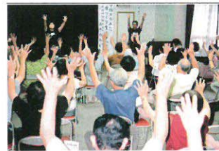
公民館 上は公民館 講座

更に、自治会連合会、各種団体と協力し地域文化の推進に努めています。平成19年4月1日から公