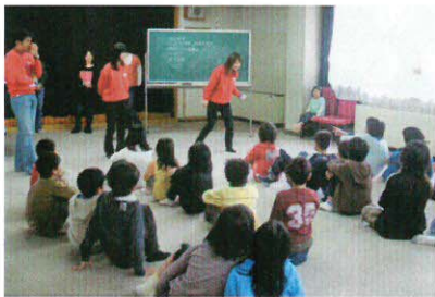
子ども会インリーダー開校式