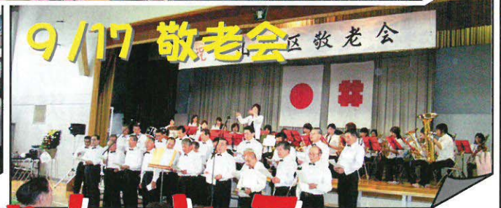
9/17 敬老会 区敬老会