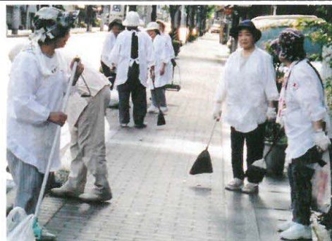
清掃奉仕活動の様子 (道三通り)