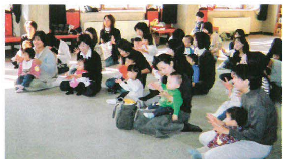
親子ふれあい教室の様子 (鷺山公民館)

社協事業として共同募金活動や、勤労者地域デビュー作戦として、今年度「鶴飼の魅力と楽しみ方」、「歴史を訪ねてウォーキング」等を計画。 「声をかけ合うまち、安心して暮らせる福祉のまちづくり」を推進していきます。