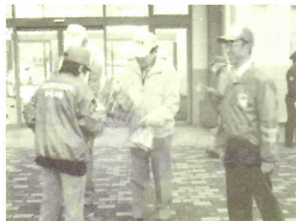
バロー長良店で活動中の皆さん