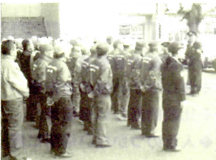
マーサ21で活動中の皆さん

各店舗の出入口で「年末年始地域安全運動」「振り込め詐欺の被害防止」のチラシ等を来店者に配付し、犯罪被害を未然に防止して、安全で平穏な新年を迎えるよう呼びかけました。