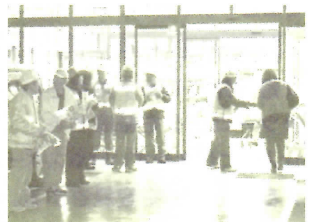
バロー栗野店で活動中の皆さん