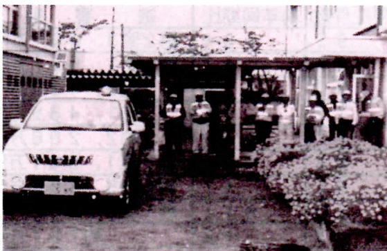
木田小学校における出発式の模様

10月24日、木田小学校において、同協議会員、木田小学校の児童や教師、岐阜市役所、岐阜北警察署等の関係者が出席して出発式が行われました。