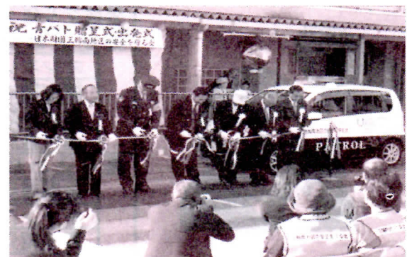
三輪南小学校における出発式等の模様

11月5日、三輪南小学校において、同会員三輪南小学校の児童や教師、岐阜市役所、岐阜北警察署等の関係者が出席して出発式並びに贈呈式が行われました。