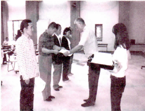
功労者表彰の模様

6月26日、岐阜市八代の北部コミュニティセンターで、岐阜北少年警察ボランティア協議会の総会が行われました。