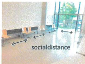
ソーシャルディスタンスを確保