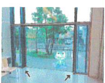
窓があり、換気のできる部屋