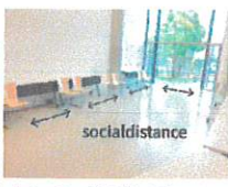
ソーシャルディスタンス