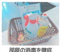
部屋の消毒を徹底