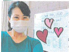
大人はマスク着用