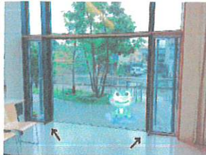
窓があり、換気のできる部屋