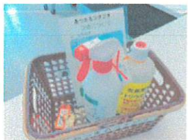
部屋の消毒を徹底