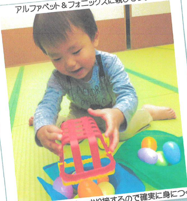
少人数制！1人1人としっかり接するので確実に身につく！