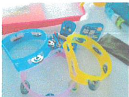
レッスンアイテムは一人1つご用意