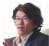
監督 園田 映人

1923年台湾生まれ。京都帝国大学農学部卒業。43年、日本陸軍に入隊。終戦後、台湾大学に編入学。米アイオワ州立大学、米コーネル大学などの留学を経て台湾大学教授に就任。71年国民党に入党。72年行政院政務委員として入閣。台北市長、台湾省政府主席、副総統を歴任。88年、蔣経国総統の死去に伴い、総統に就任。90年の総統選挙、96年の台湾初の総統直接選挙で選出され、総統を12年務め、台湾の民主化を実現。2000年任期満了により退任。