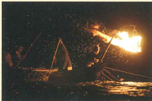
② 船乗り (左側の船頭) と中乗り (右側の船頭) が鵜匠と息を合わせて操船

国の文化財に指定されている長良川鵜飼。鵜舟の船頭は、鵜飼を支える重要な役割を担います。シーズン中に毎晩鵜舟を操船することに加え、鵜飼で使用する道具を鵜舟に積み込む作業など、鵜飼の準備全般も行い、鵜匠をサポートしながら日々仕事をしています。