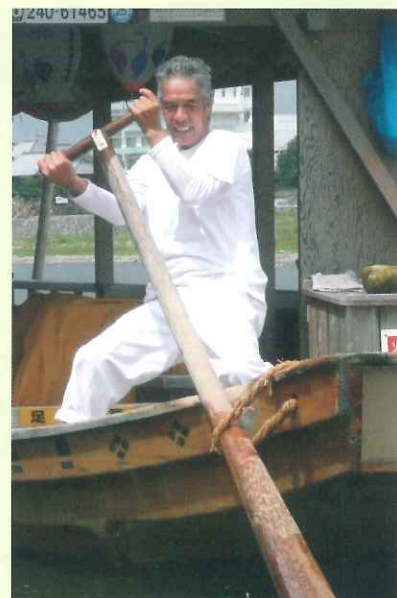
③ 櫂を使用する舳 (船尾側) の船頭