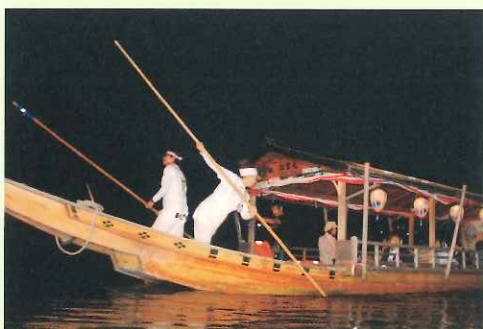
① 棹を使用する舳 (船首側) の船頭

観覧船の船頭は、鵜飼を引き立てる名脇役。乗客が安全かつ快適に鵜飼を楽しむことができるよう、船を自由自在に操ります。また、鵜飼の解説や、お茶の提供など、最大限のおもてなしをします。笑顔で粋に船を操る姿は、乗客を魅了します。