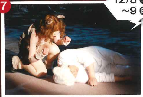
劇団ラッキー・キャッツ 『ファッション~たやかなる星屑子の栄枯盛衰~』