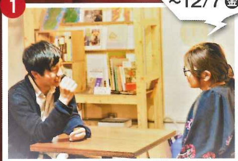
演劇ニッケル 『神無町 筆記本シリーズ』