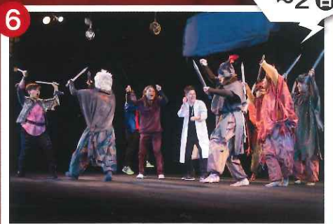
岐阜ろう劇団いぶき 『あきらめない人々~チェーホフ短編集~』