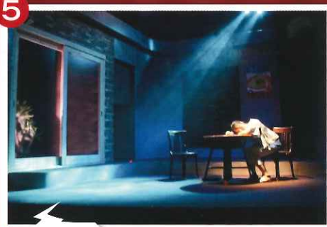
劇団あとの祭り 『本格推理(ミステリー)には程遠い』