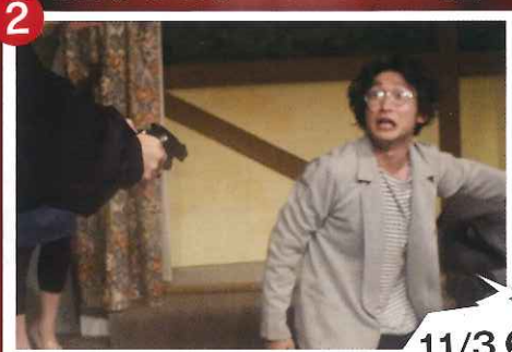
劇団ゼロ 『ねずみとり The Mousetrap』