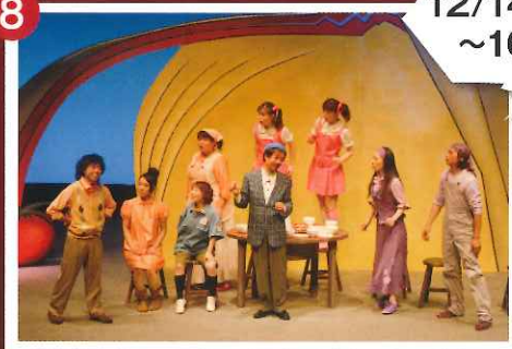
劇団はぐるま 『こそあどの森の物語 はじまりの樹の神話』