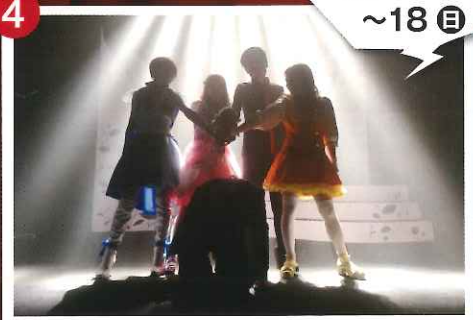
劇団アルデンテ 『DDDD=デス屋で働くデーモンなターロン=』