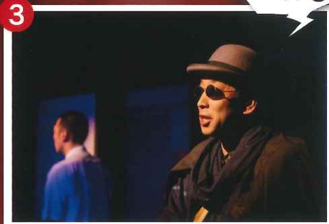
劇団芝居屋かいとうらんま 『月見里教授と箱』