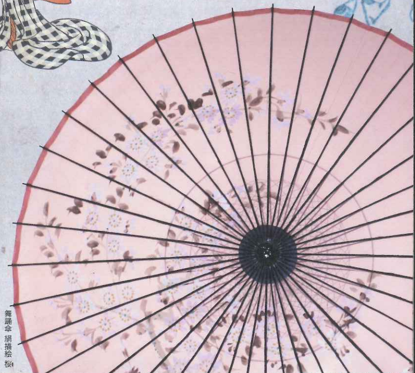
舞踊傘 絹描絵 榎