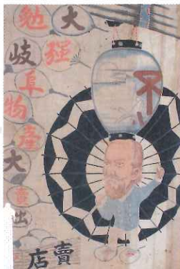
岐阜物産店宣伝幕