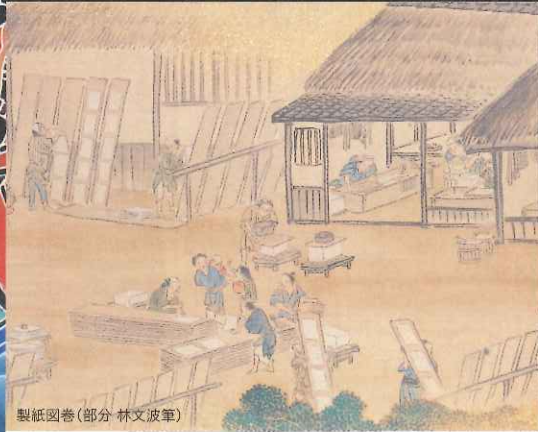
製紙図巻(部分 林文波筆)