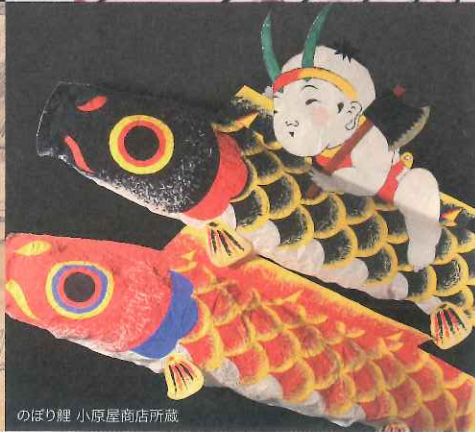
のぼり鯉 小原屋商店所蔵