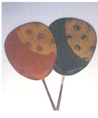
第6回東海輸出工芸展出品 岐阜団扇 住井富次郎商店所蔵