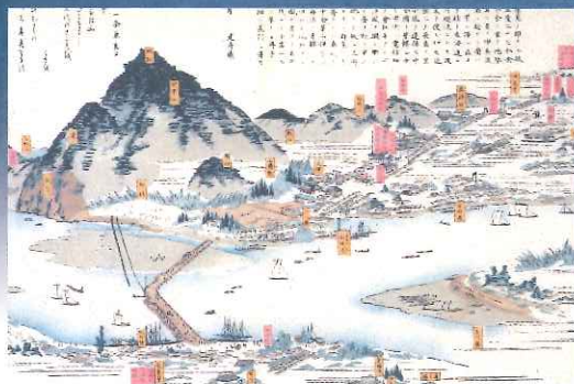
岐阜市街鳥瞰図(部分)

平成30年 7.27[金]→9.9[日] 休館日/毎週月曜日(8月13日[月]は開館) 開館時間/午前9時～午後5時 (最終入館は午後4時30分まで) ※7月27日(金)は午前10時から開場