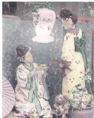
ポストカード ジャポネズリー(部分)

美濃地方は古くから良質な竹や和紙の産地に恵まれ、長良川中流域に位置する岐阜は水運を利用した物資の集散地となっていました。このような地理的条件のもと、岐阜では良質な竹や和紙を材料とした傘・提灯・団扇の生産が発達し、名産品として名を馳せたほか、清らかな水を利用した染物も盛んに行われてきました。これらは日常の用具であるだけでなく、その繊細優美なデザインで多くの人の目を惹き、特に明治以降は海外でも高い評価を得ました。さらに近年ではこれらの伝統的なモノ作りは文化としても評価され、国の伝統的工芸品や登録有形民俗文化財、県の郷土工芸品などの指定を受け、職人の製作技術についても注目が高まっています。本展ではこれらの歴史や卓越した機能、デザイン、職人の手仕事の道具などを紹介し、その魅力に迫ります。