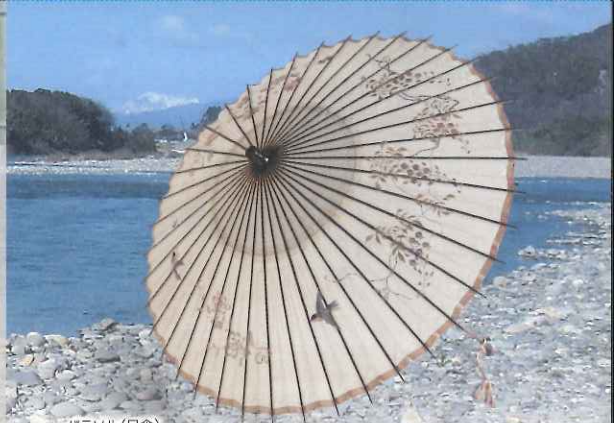
パラソル(日傘)

■講演会 「無形文化財としての伝統工芸—日本における保護と振興—」 8月18日(土) 14:00~15:30 講師:金沢美術工芸大学学長 山崎剛さん 定員:200名 無料 ※開催日前日まで岐阜市歴史博物館へ電話申込(ただし定員になり次第締切)