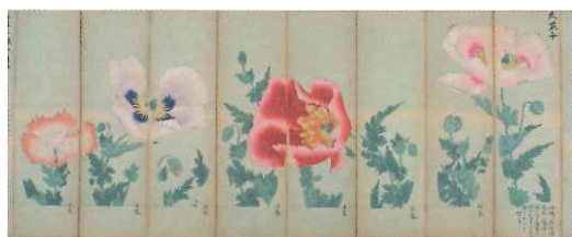
提灯絵紙鑑込見本 大芥子

美濃地方は古くから良質な竹や和紙の産地に恵まれ、長良川中流域に位置する岐阜は水運を利用した物資の集散地となっていました。このような地理的条件のもと、岐阜では良質な竹や和紙を材料とした傘・提灯・団扇の生産が発達し、名産品として名を馳せたほか、清らかな水を利用した染物も盛んに行われてきました。これらは日常の用具であるだけでなく、その繊細優美なデザインで多くの人の目を惹き、特に明治以降は海外でも高い評価を得ました。さらに近年ではこれらの伝統的なモノ作りは文化としても評価され、国の伝統的工芸品や登録有形民俗文化財、県の郷土工芸品などの指定を受け、職人の製作技術についても注目が高まっています。本展ではこれらの歴史や卓越した機能、デザイン、職人の手仕事の道具などを紹介し、その魅力に迫ります。