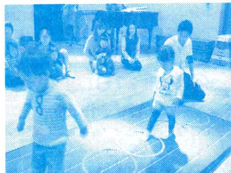
↑ はじめての体操教室