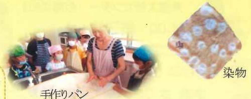
平成 29 年 8/23 「イキイキ・ワクワク匠の町」 集合写真