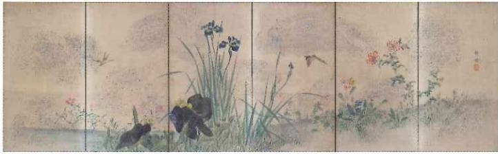
幸野樸庵(四季草花図屏風)明治期